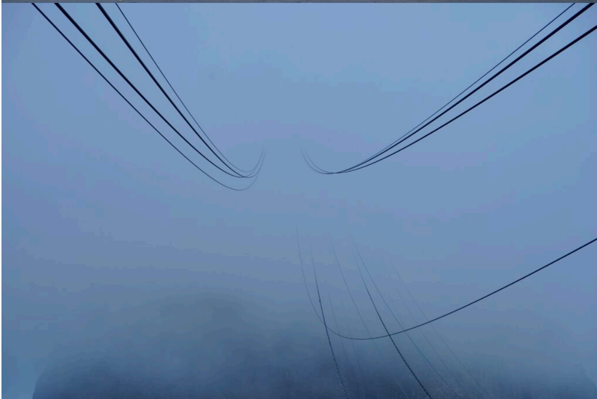
Auf dem Weg zum Zuckerhut