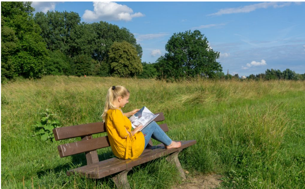
Studieren und reisen