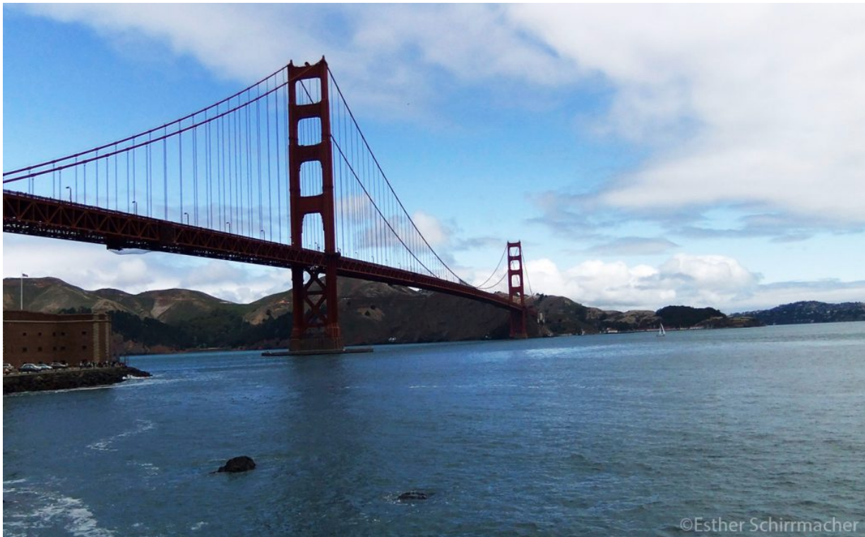
Die Golden Gate Bridge in San Francisco