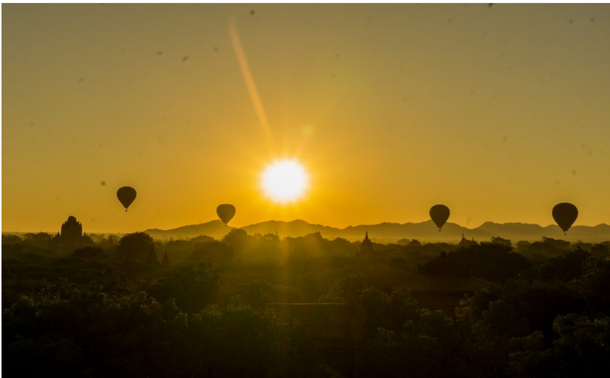
Bagan am Morgen