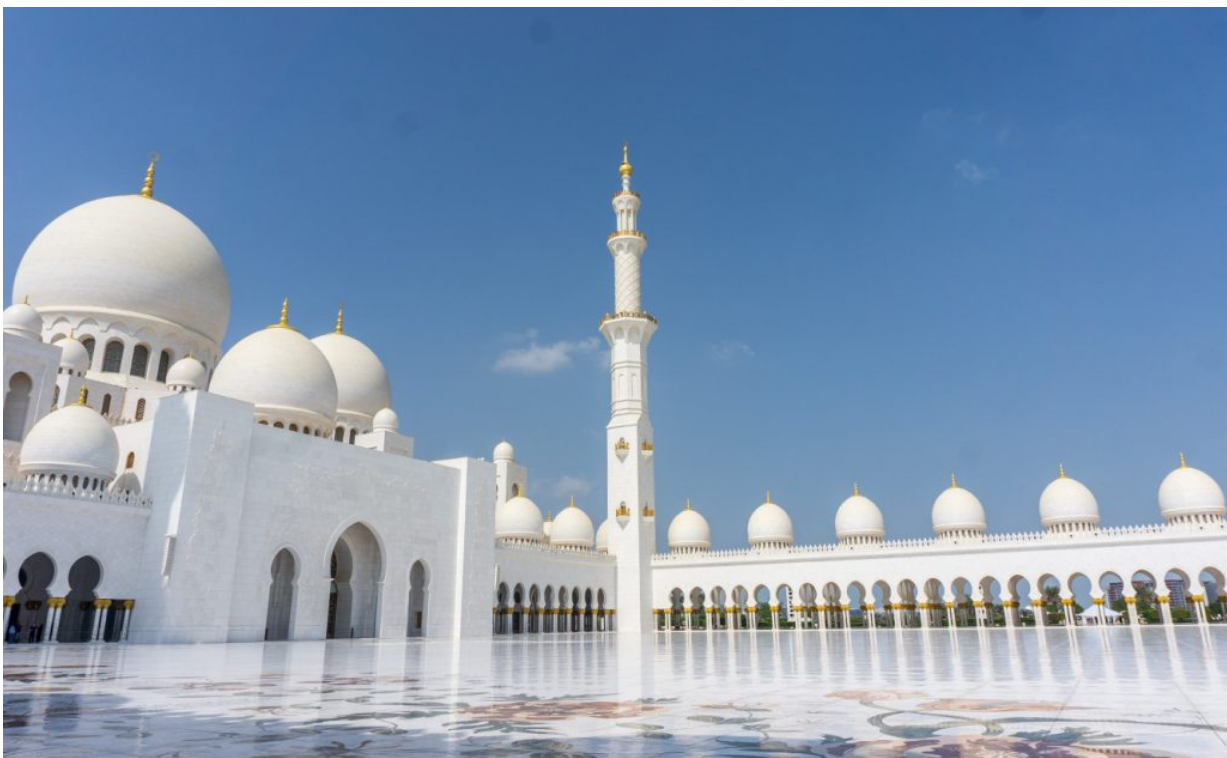
In der Moschee