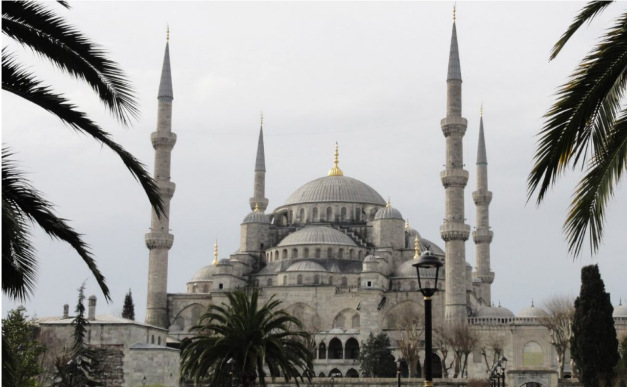
Die Blaue Moschee in Istanbul