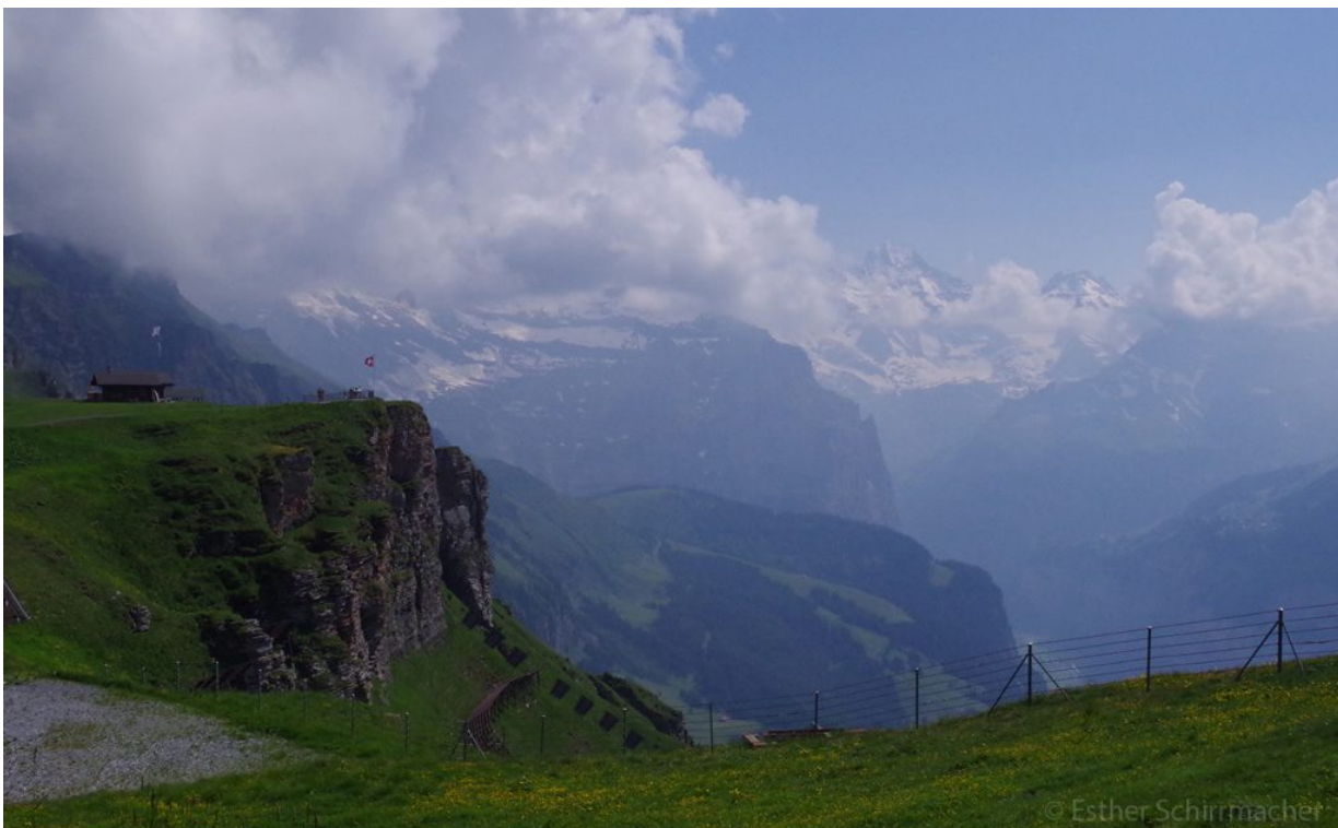
In der Schweiz