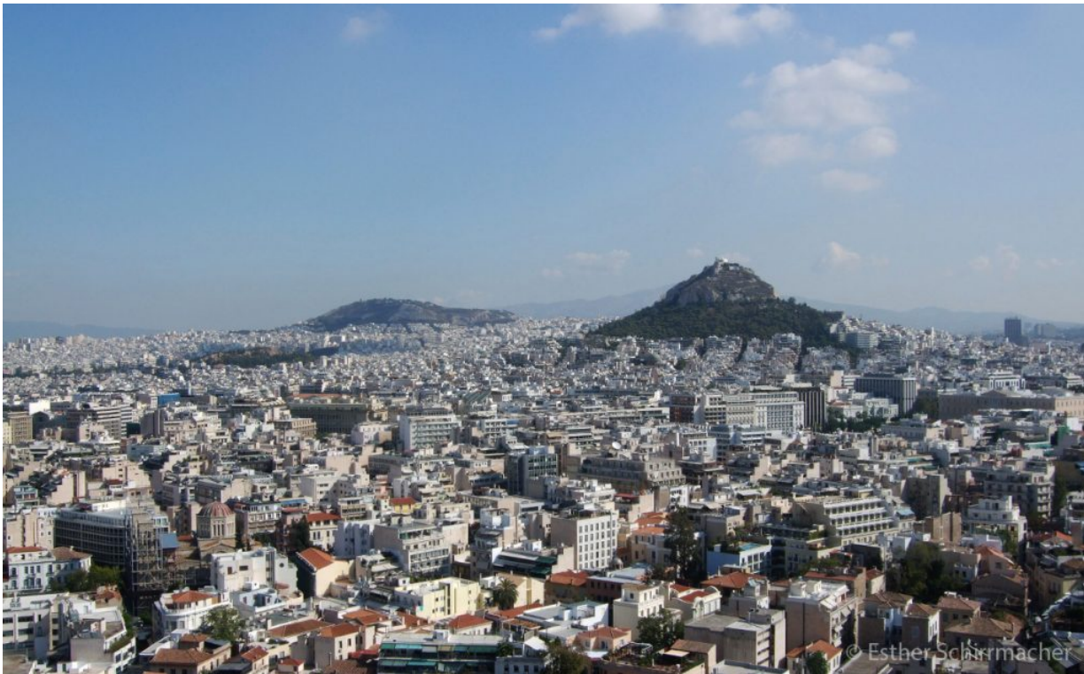
Athen von oben