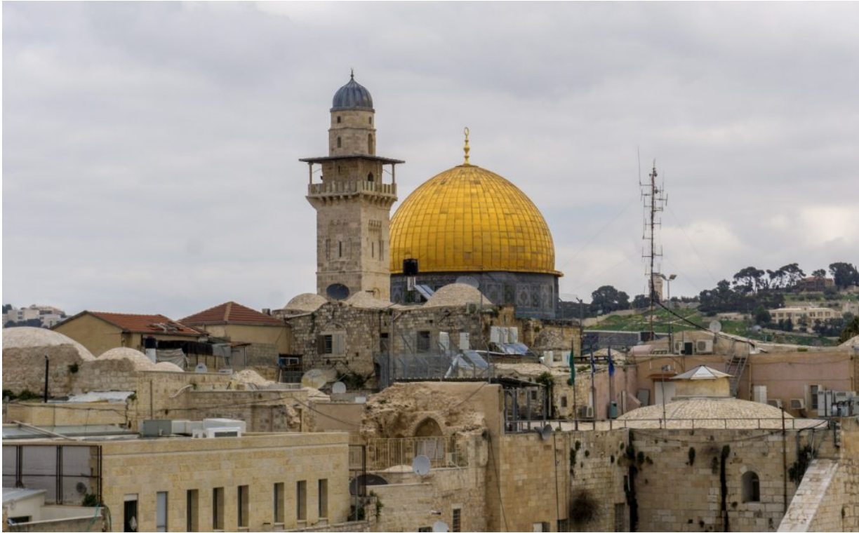
Jerusalem, mein neues Zuhause