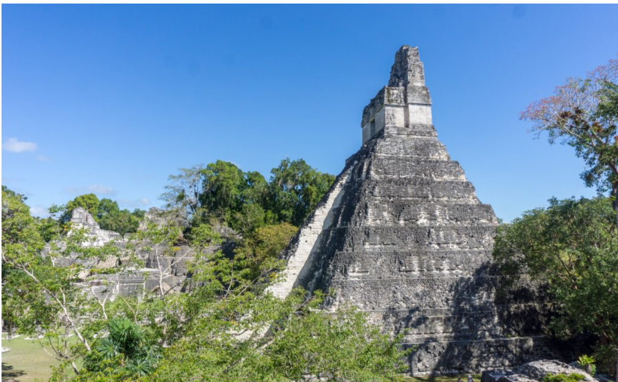
Tikal in Guatemala