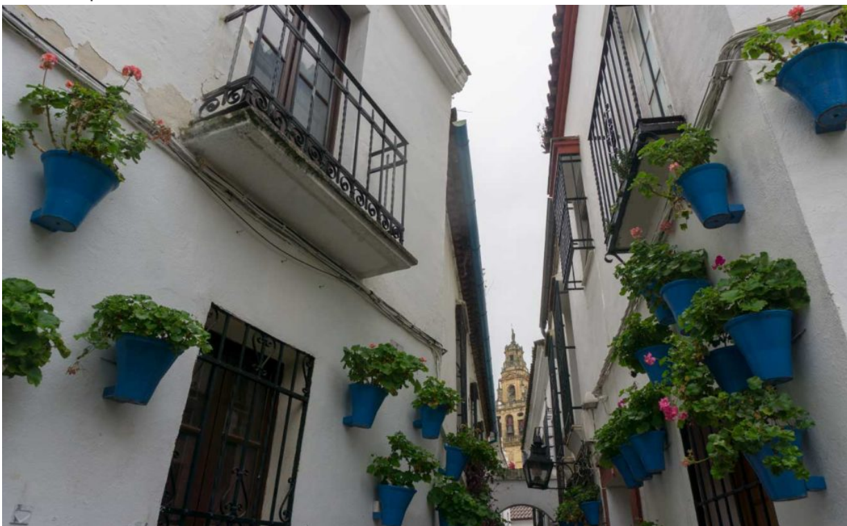
Die Innenstadt von Córdoba