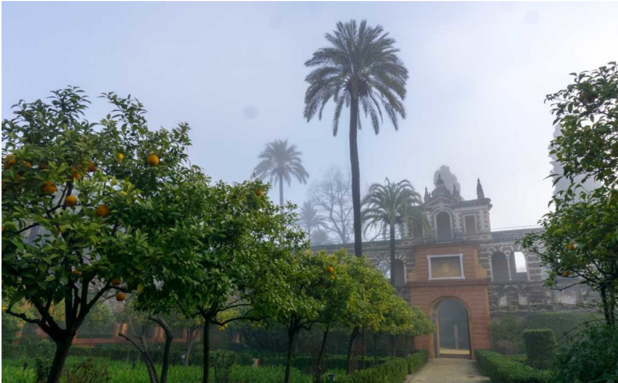
Der Real Alcázar in Sevilla