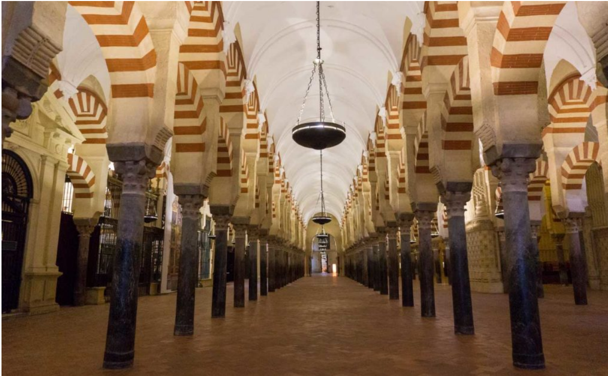
Die Mezquita in Córdoba