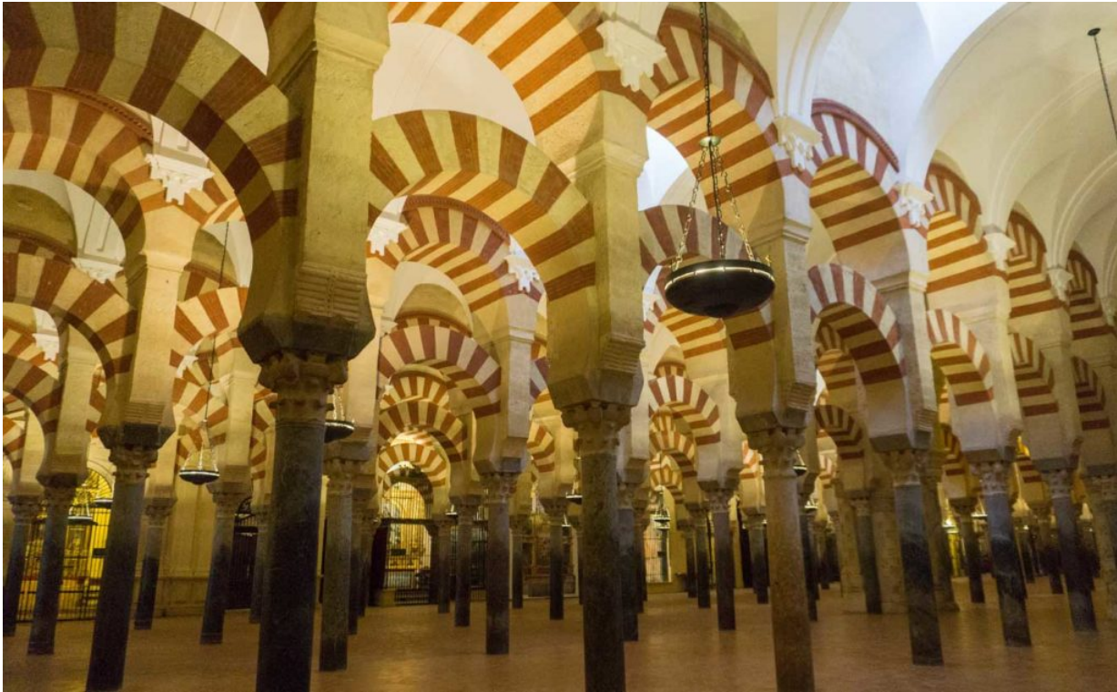
Die Mezquita-Kathedrale 2020