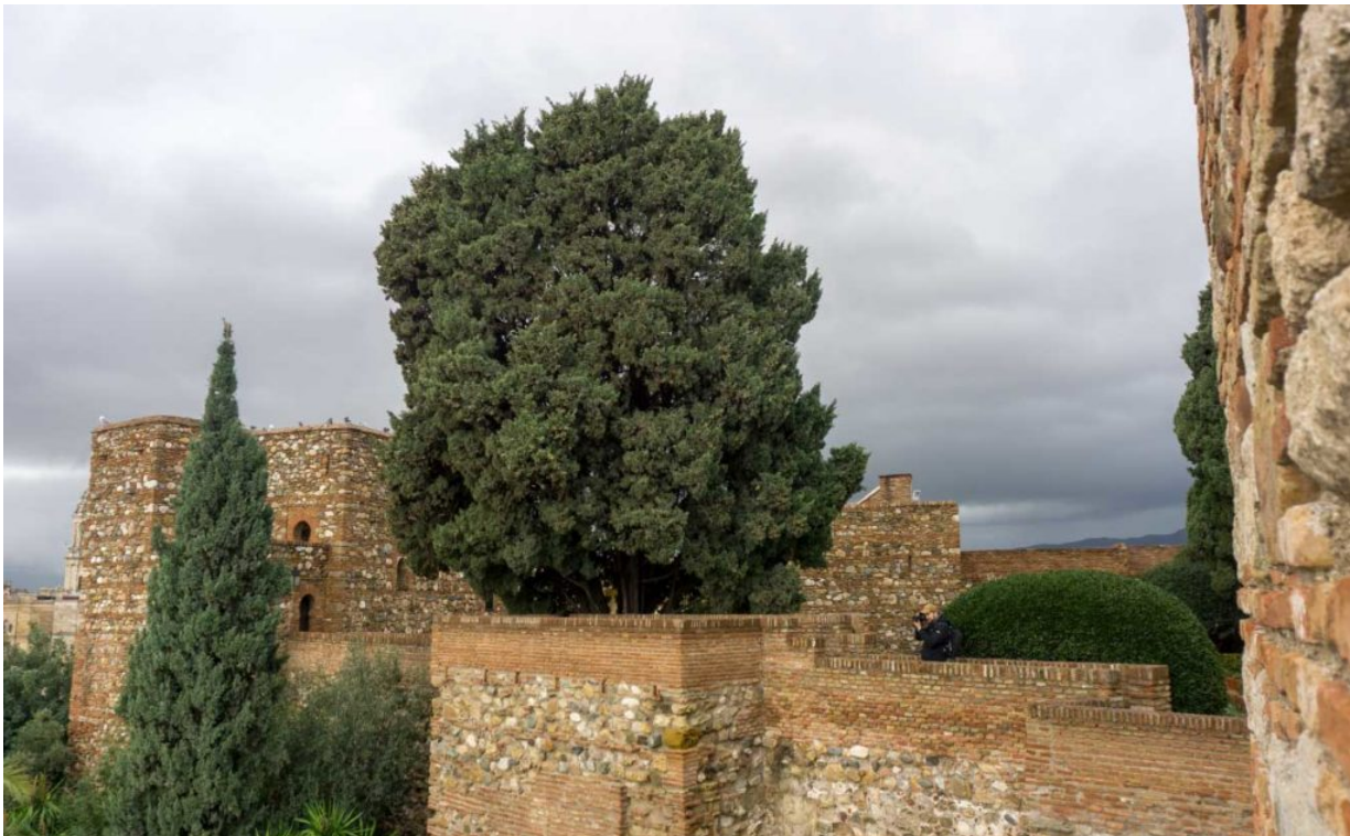
Auf der Alcazaba