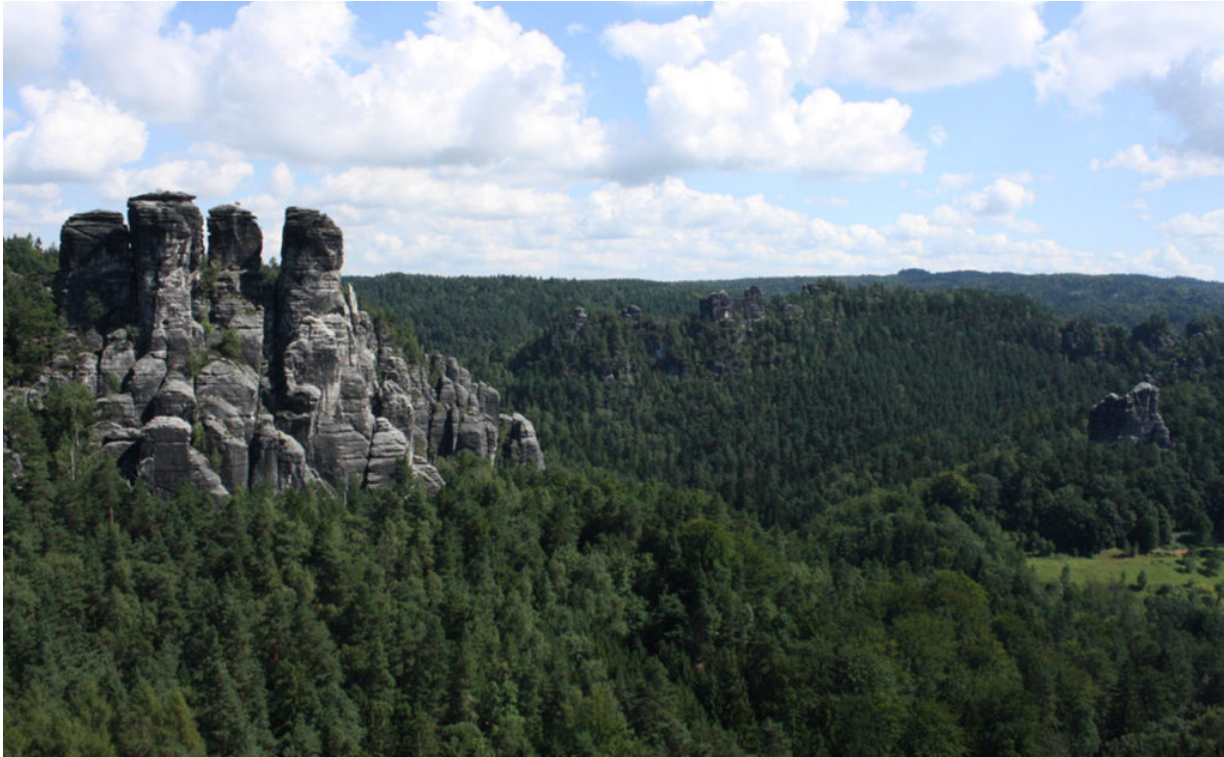
An der Bastei

Meiner Meinung nach die schönste Wanderregion in Deutschland.