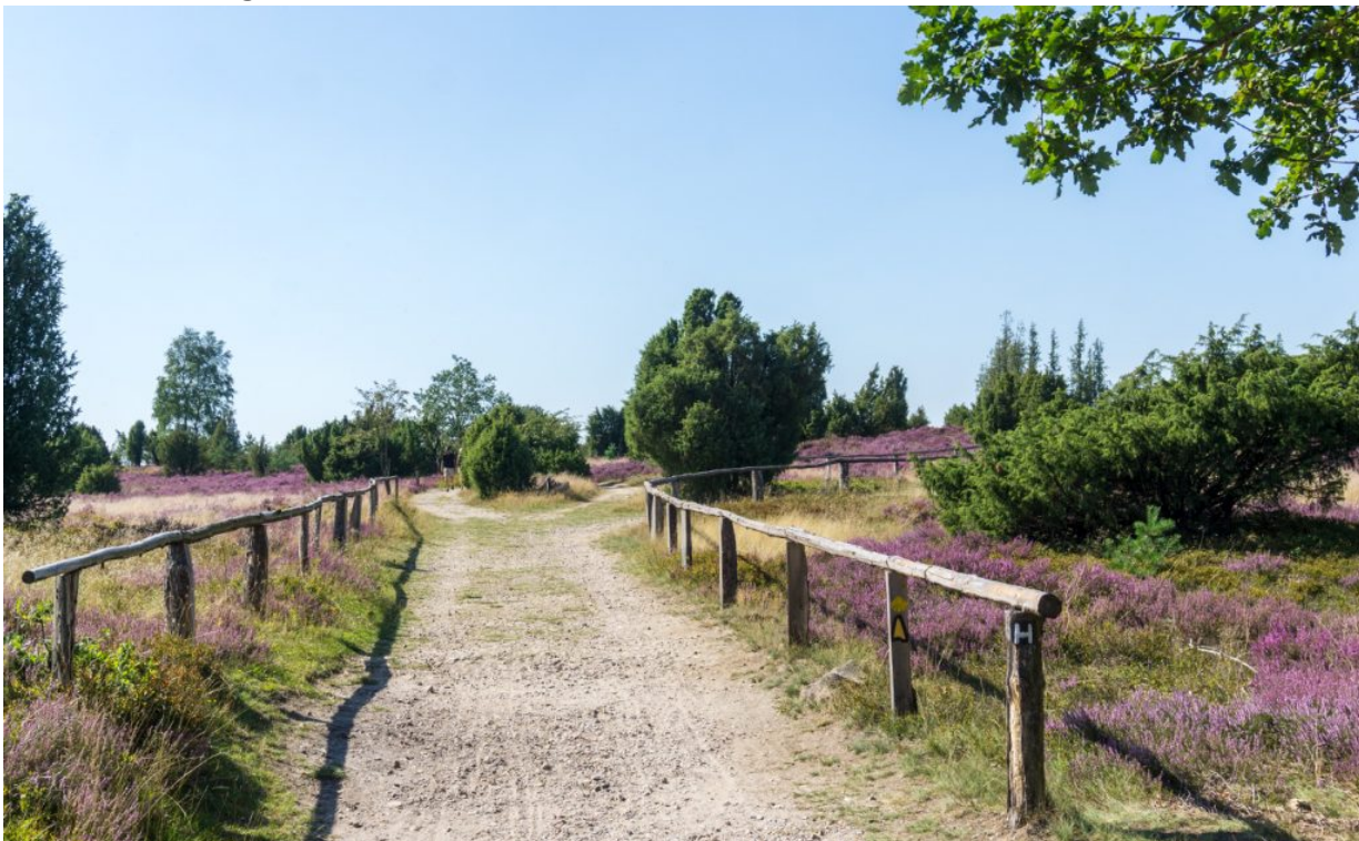
In der Lüneburger Heide