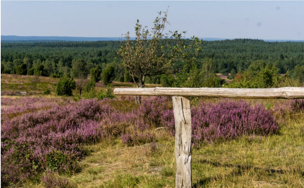
In der Lüneburger Heide

Letzten Sommer waren wir in der Lüneburger Heide.