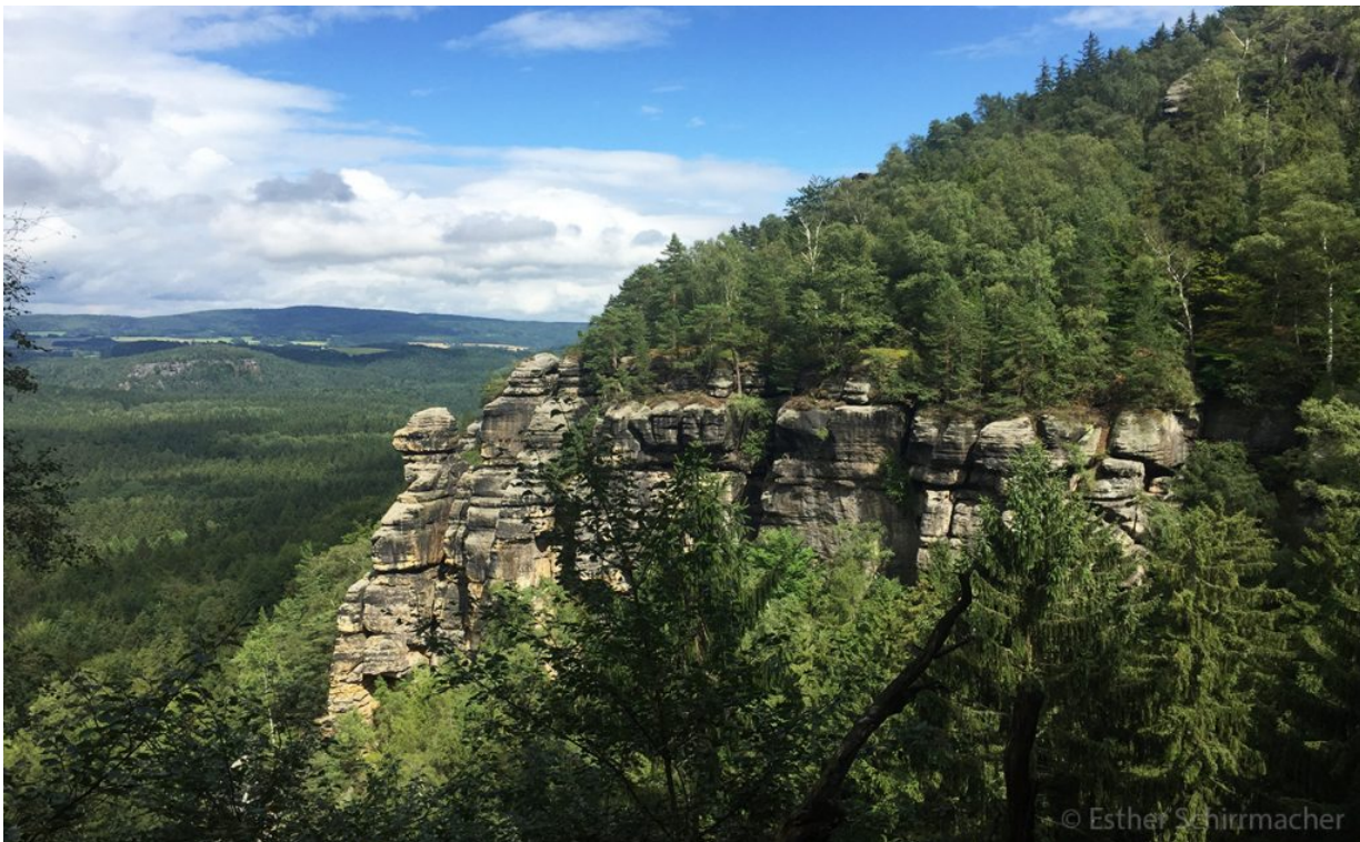
Die Sächsische Schweiz