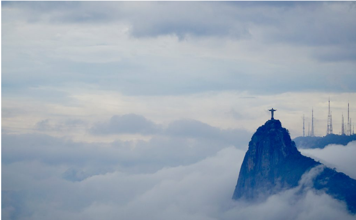
Nebel in Rio