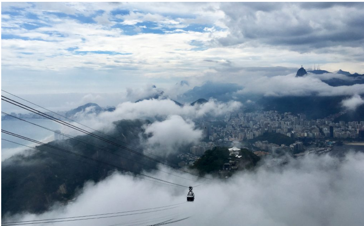
Rio de Janeiro