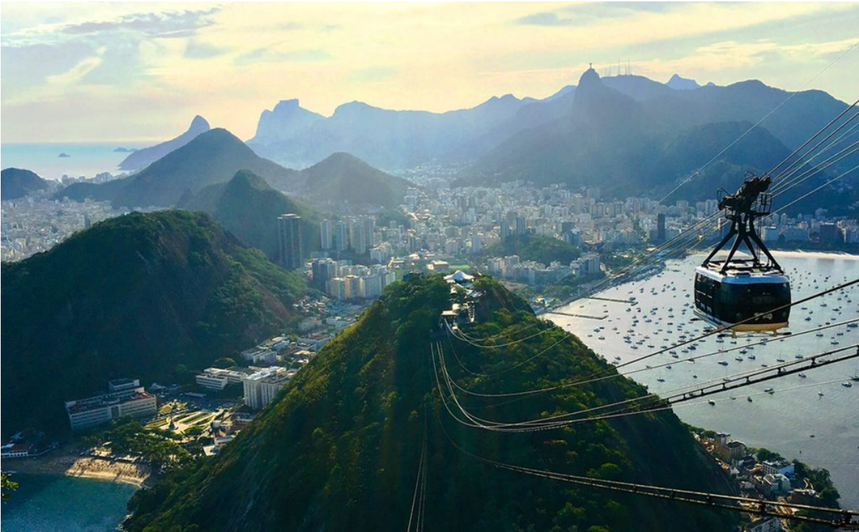
Rio de Janeiro