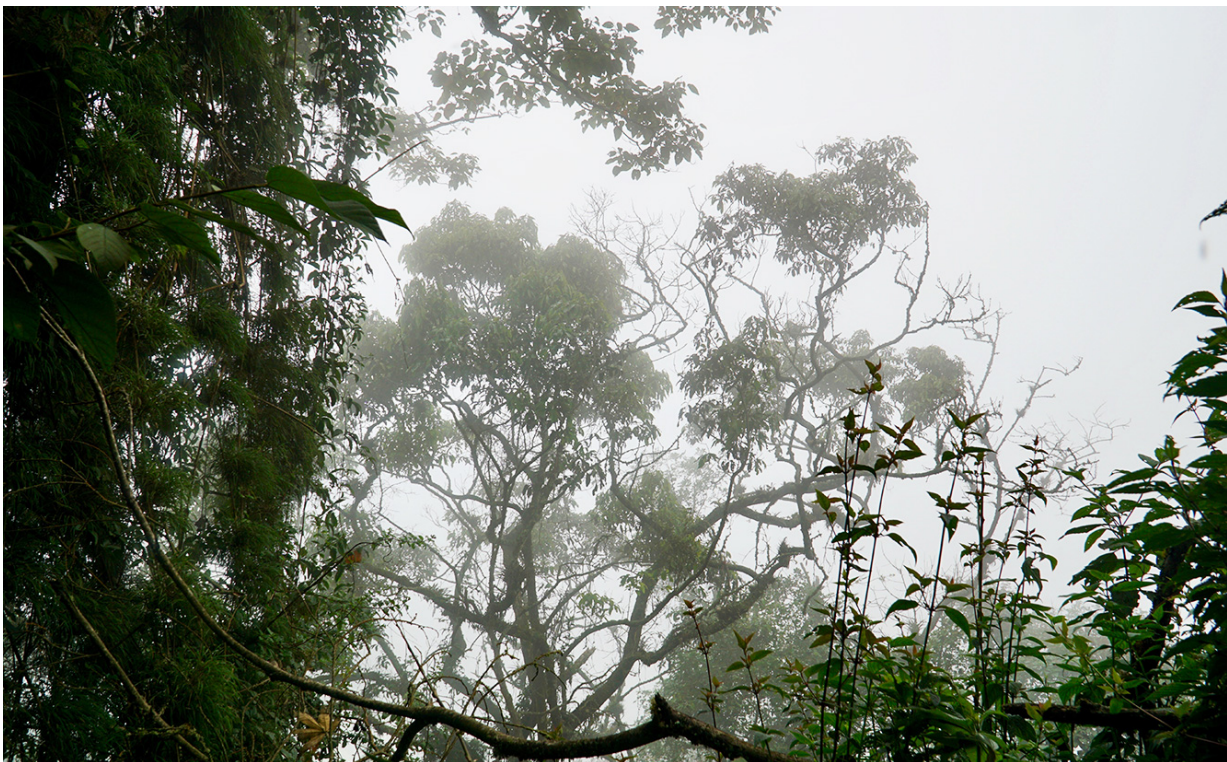
Nebel zieht auf