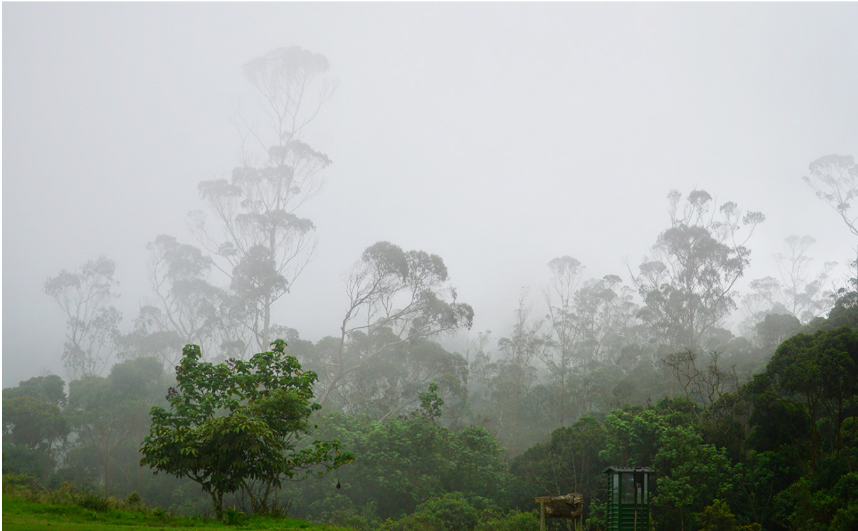
Das Ende unserer Route