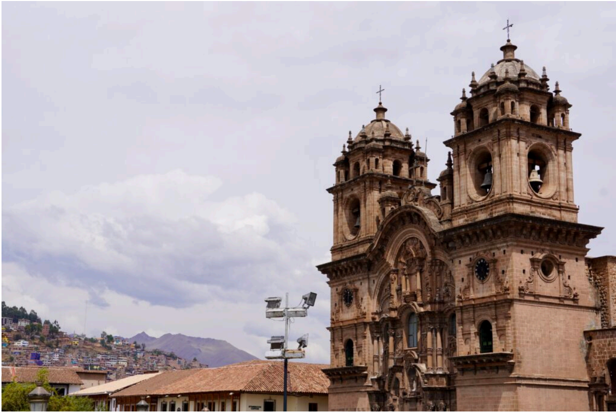
In Cusco geht es los