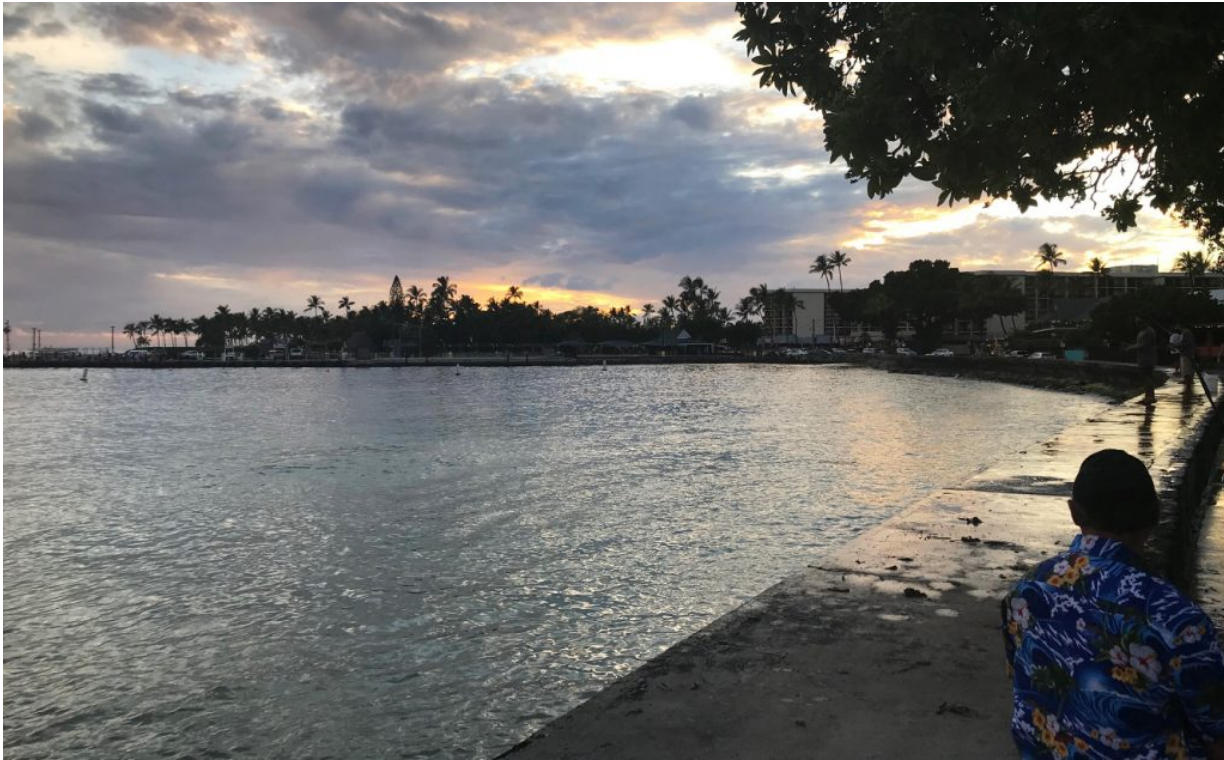
In Port Moresby