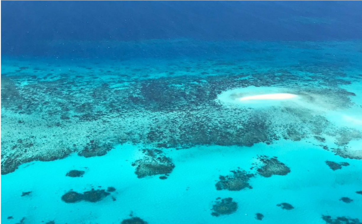
Das Great Barrier Reef von oben