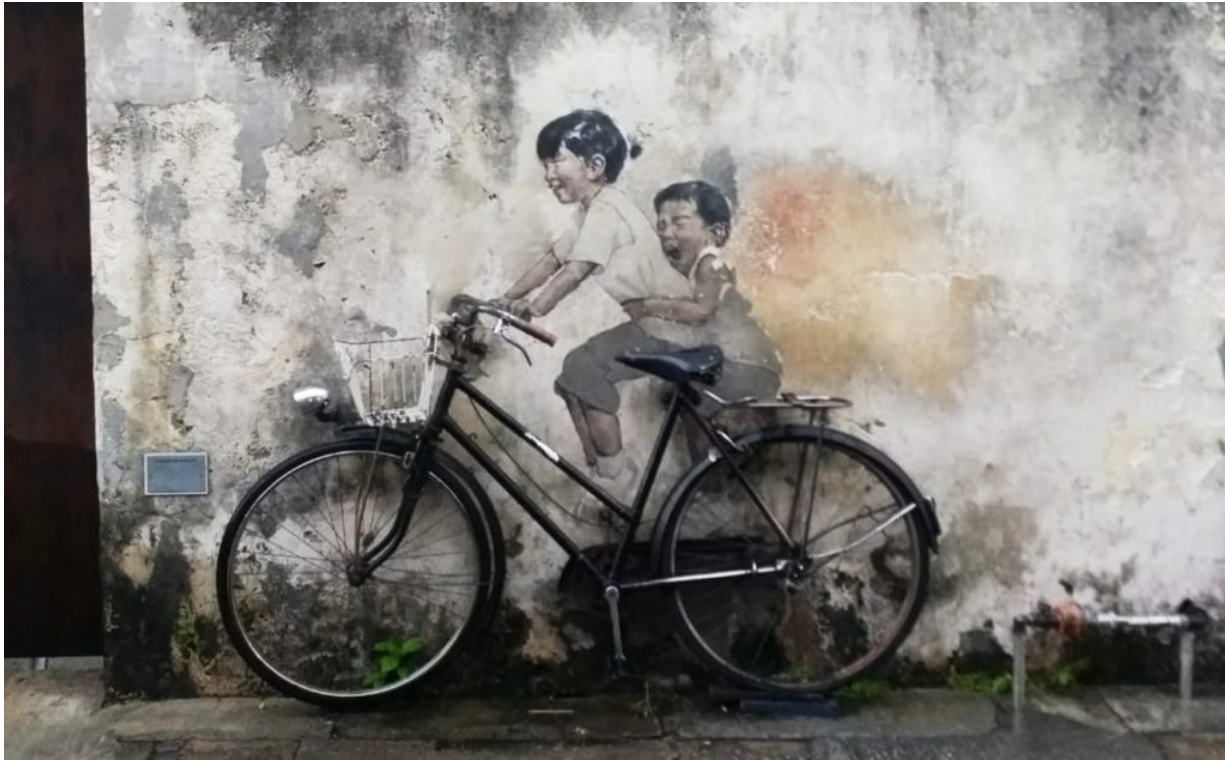
das berühmte Graffiti