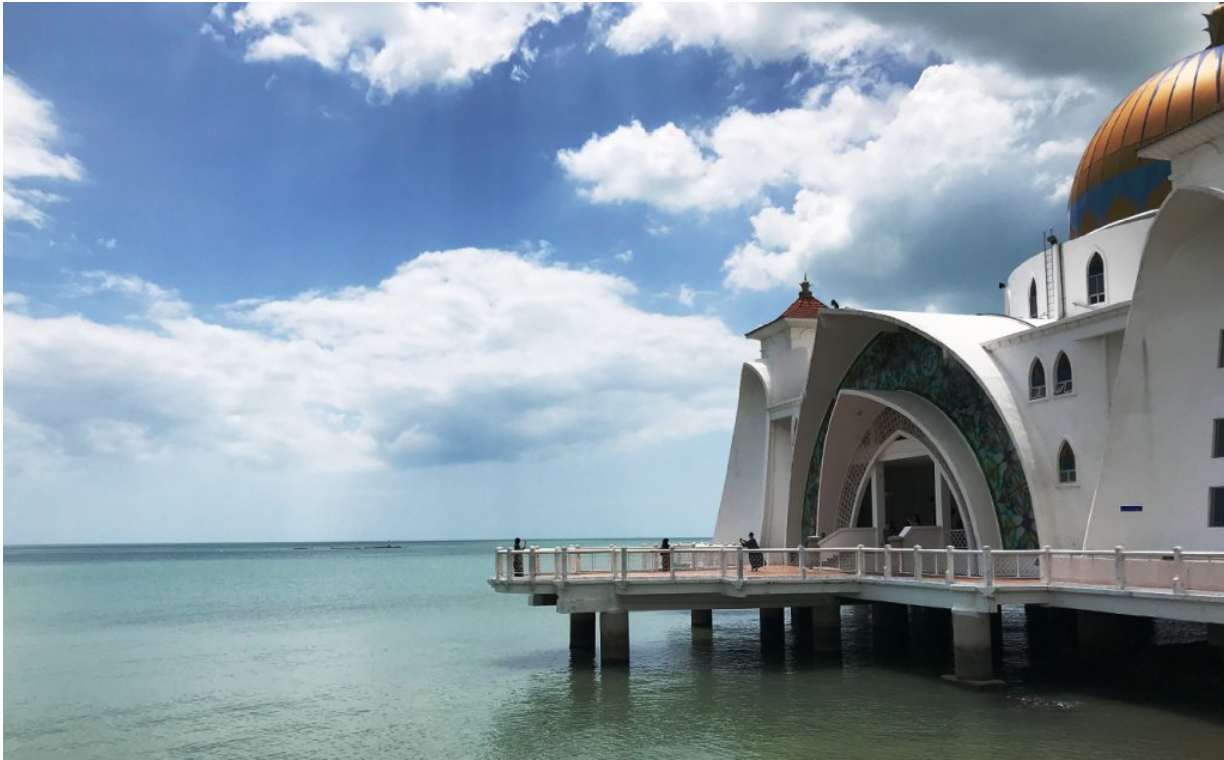
Die Malakka Straits Moschee