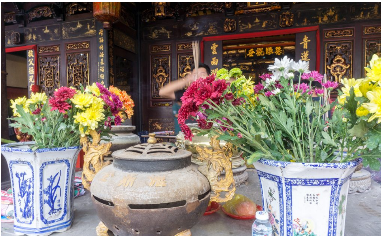
ein Tempel in Malakka