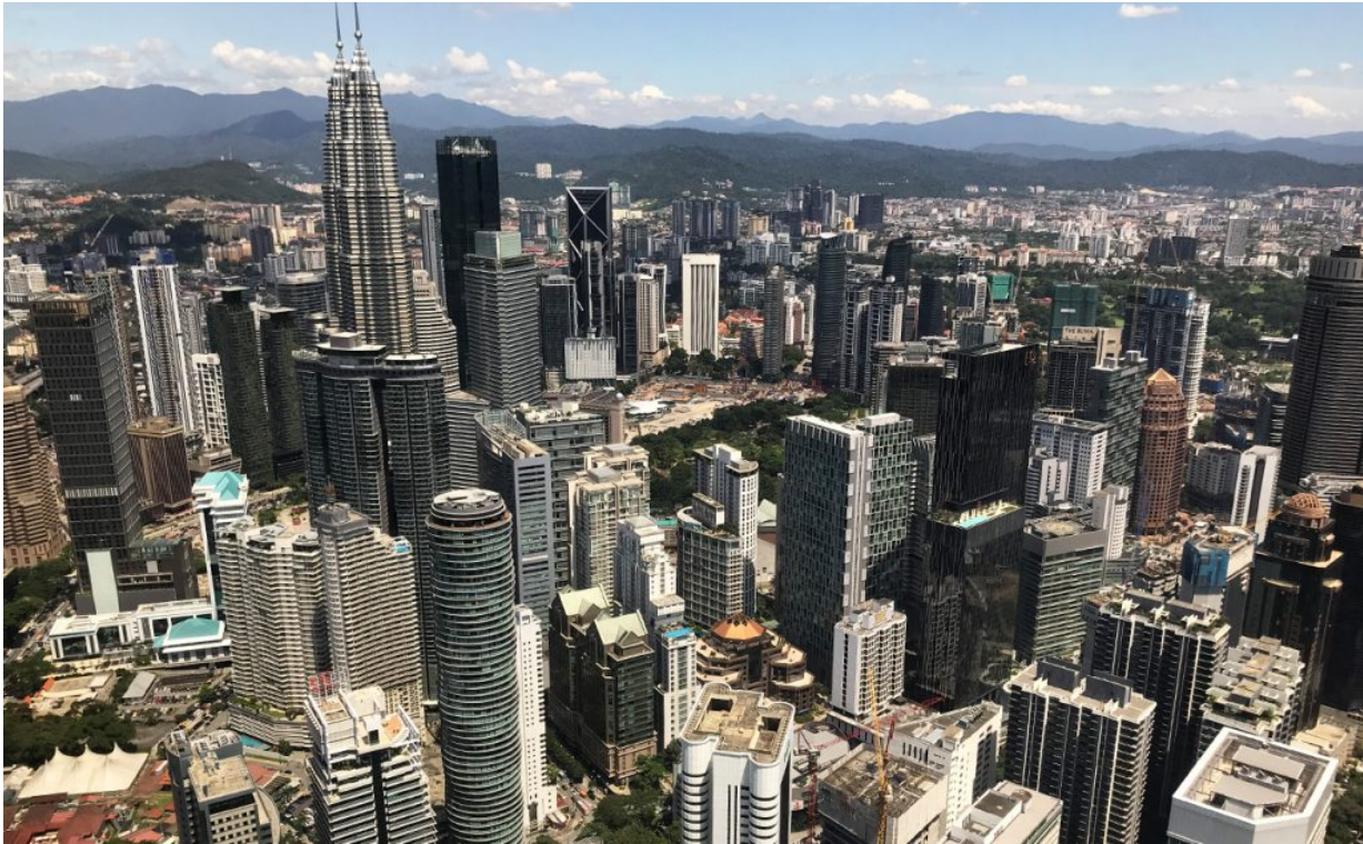
Kuala Lumpur von oben