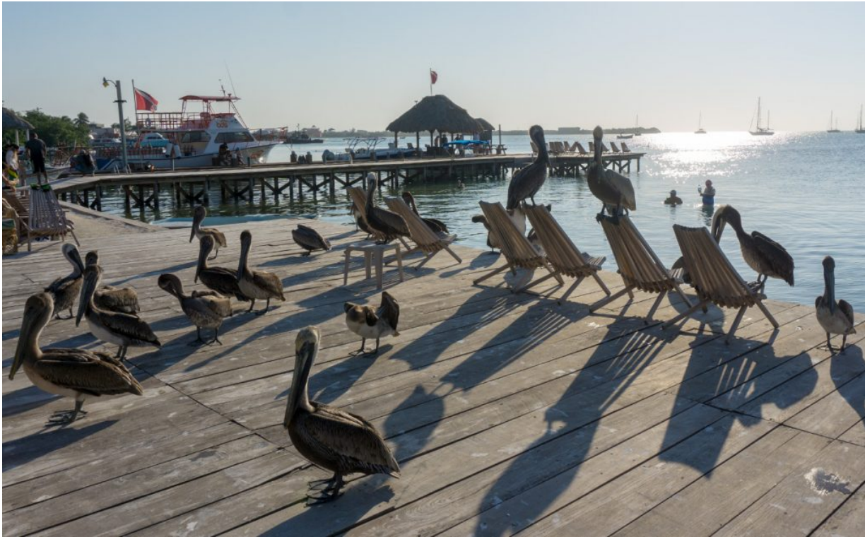
Pelikane in Belize