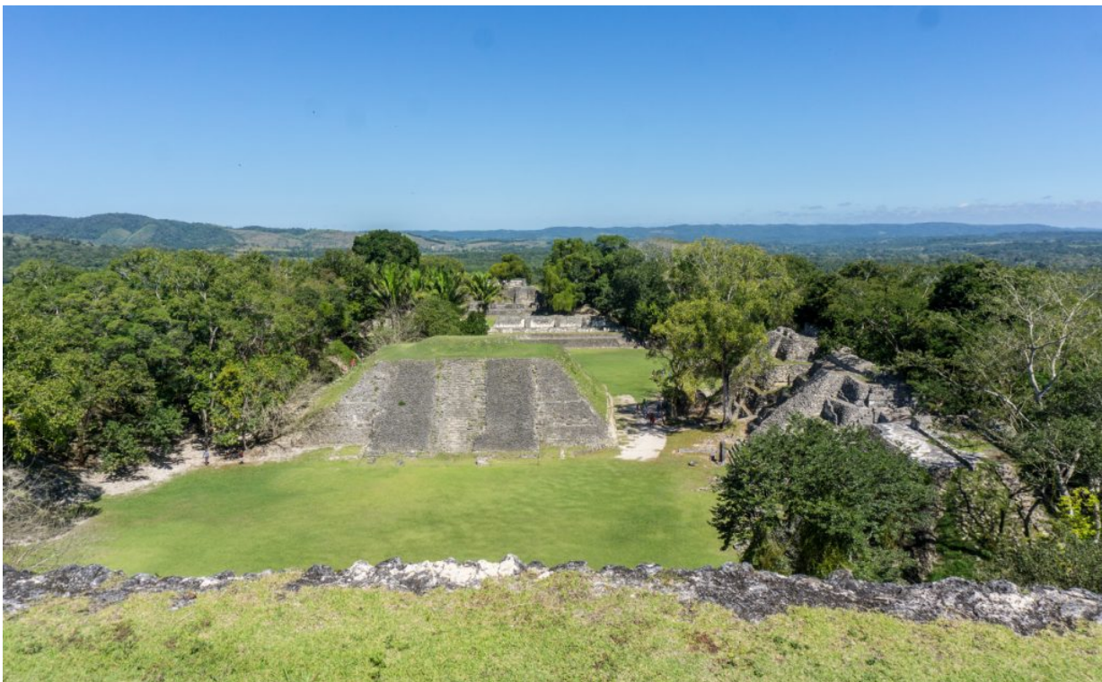
bei San Ignacio