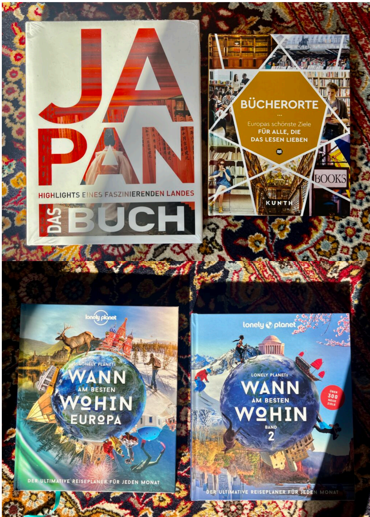
Die Bücher wurden mir kosten- und bedingungslos vom Verlag zur Verfügung gestellt. Das