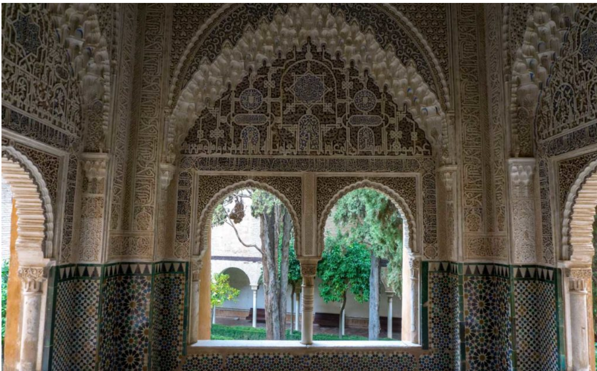
In der Alhambra