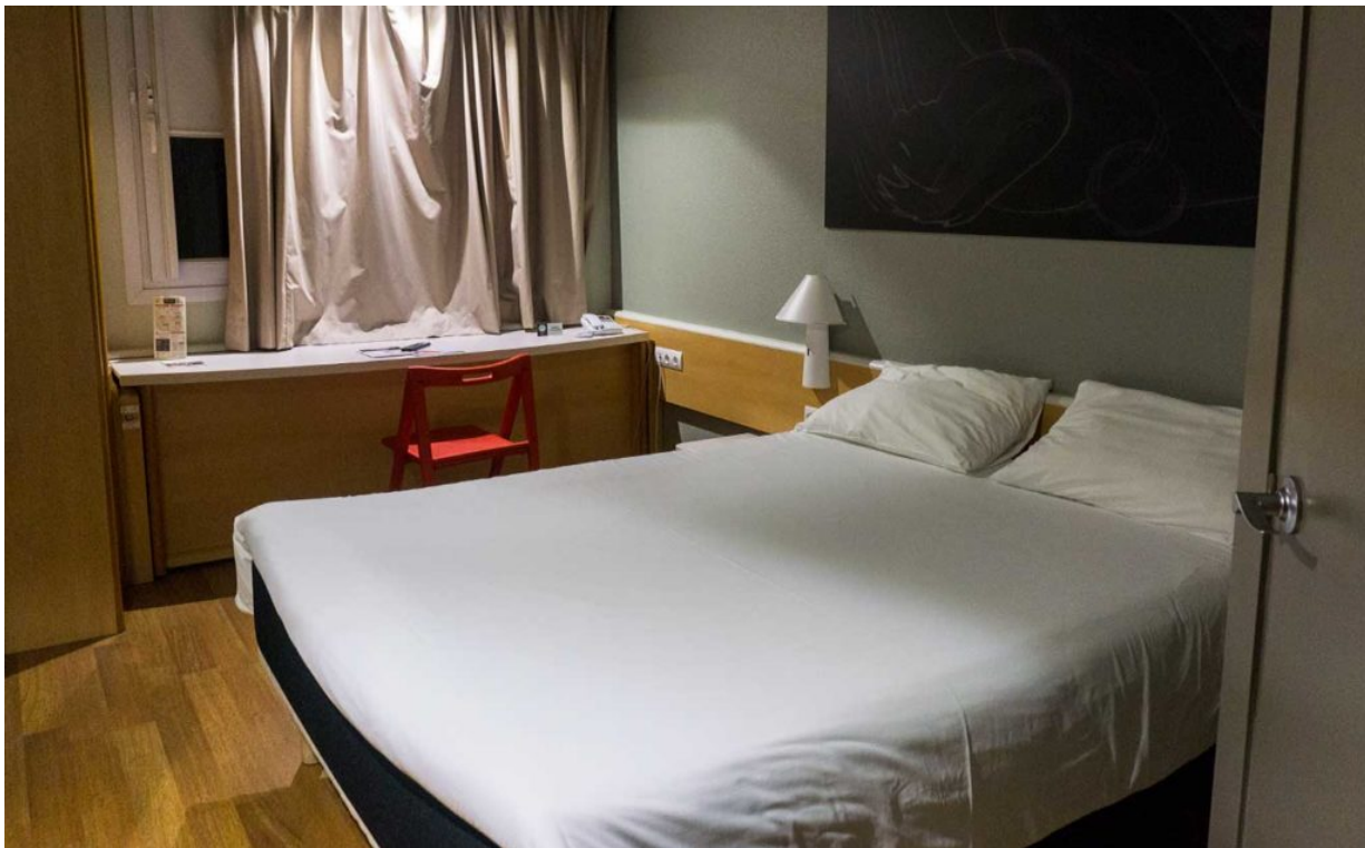
Unser Zimmer im ibis Granada

Das Hotel ibi in Granada war so freundlich, uns einzuladen, das hat keinen Einfluss auf meine Meinung.