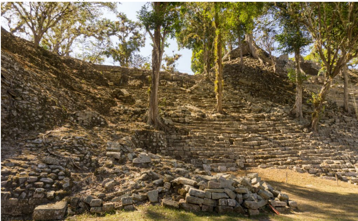
hier darf man auch klettern gehen