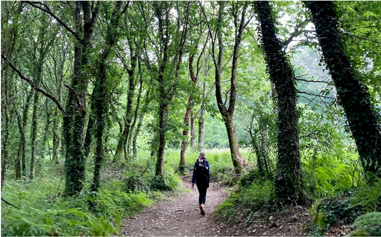
eine weitere Pilgerin!