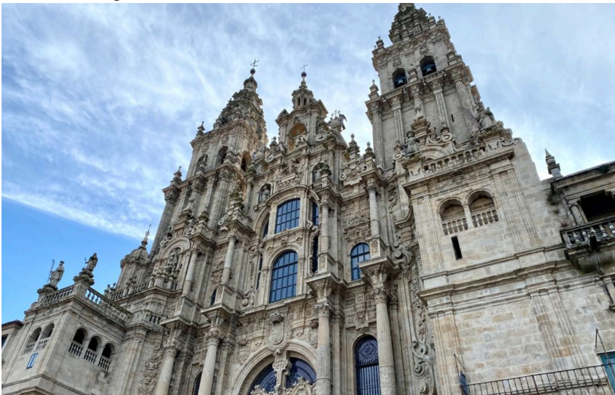
in Santiago angekommen