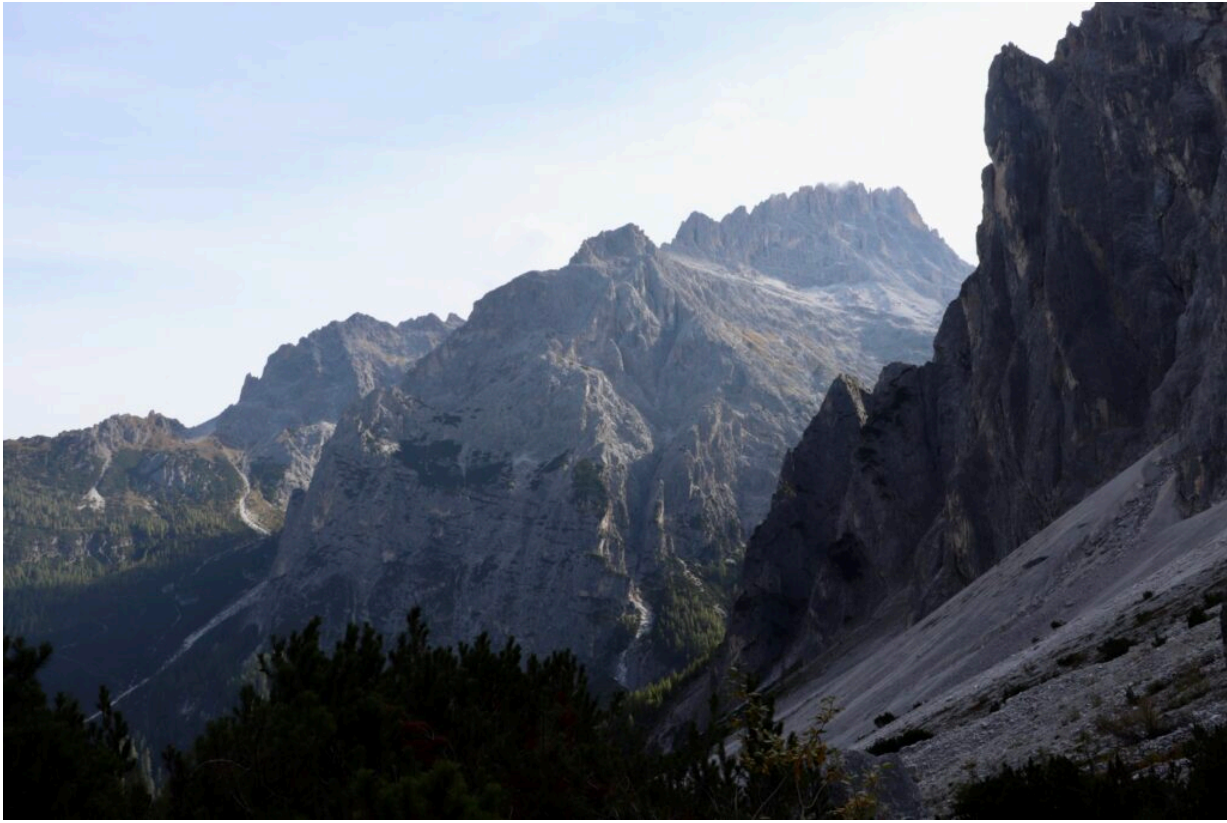
In den Dolomiten