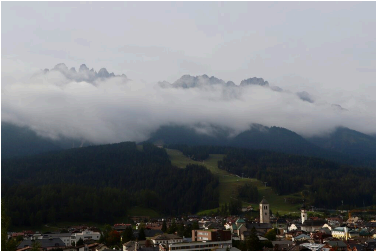
Die Aussicht vom Pool aus