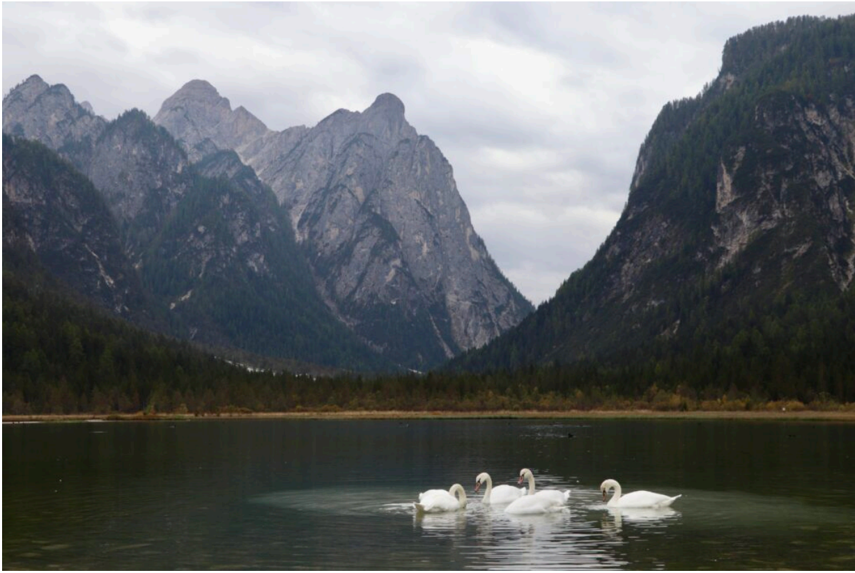
Der Toblacher See