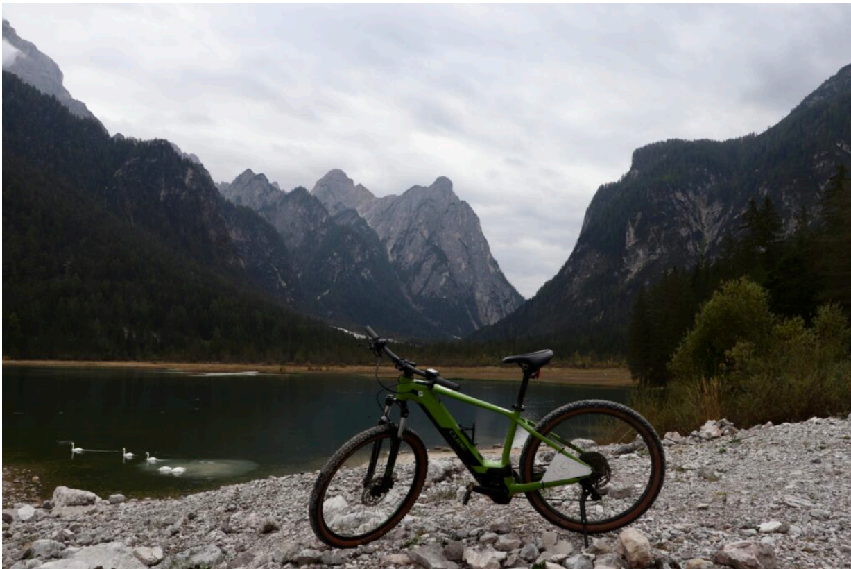
Unterwegs mit E-Bikes