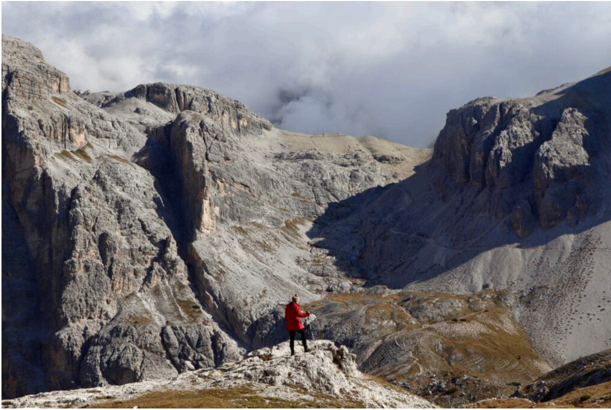
Auf unserer Wanderung