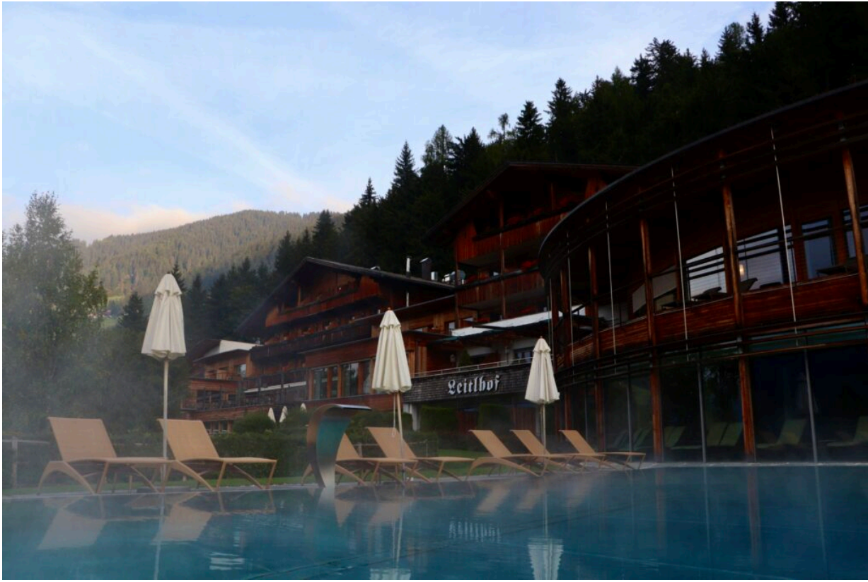
Der beheizte Außenpool