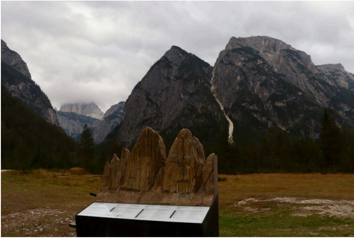
Die 3 Zinnen im Nebel

Das Naturhotel Leitlhof hat uns freundlicherweise zu dem 4-tägigen Aufenthalt nach Italien eingeladen. Ganz herzlichen Dank auch an die Angelika Hermann-Meier PR Agentur für die Vermittlung.