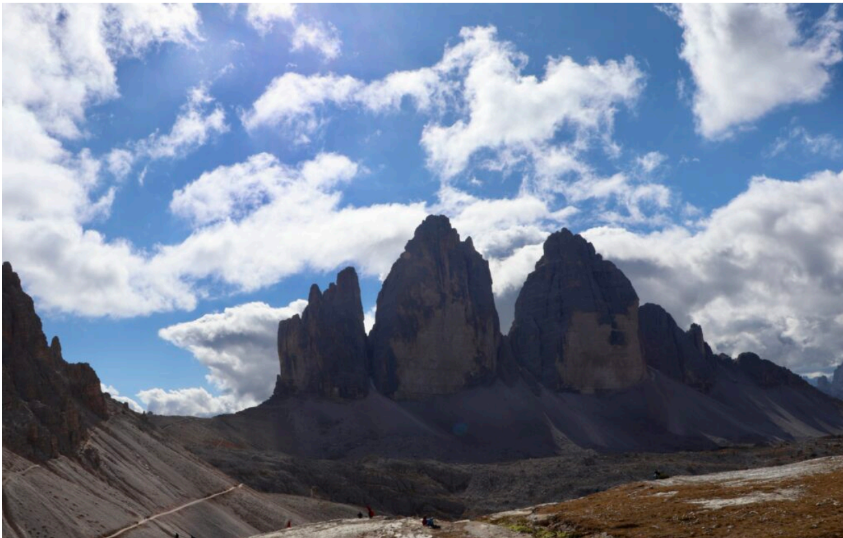
Die Drei Zinnen