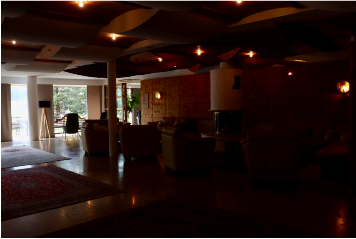
Der Innenbereich des Hotels